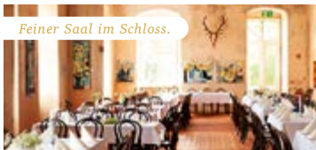
Feiner Saal im Schloss.

Ihre Konzerte sind ein Genuss und sie wird den feinen Saal im Schloss weihnachtlich verzaubern.